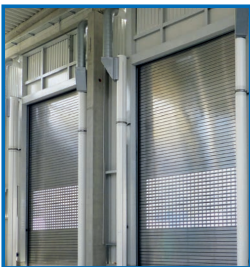
Schadstoffschutz, Abfallsortier- und Aufbereitungsanlage